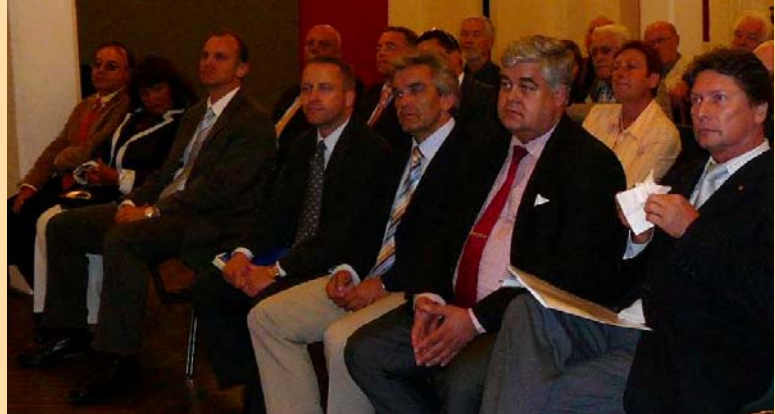
Vortrag und Diskussion zum Thema Kreisverkehr

Eine weitere Station im Besuchsprogramm war der Tiefbunker am Feuerbacher Bahnhof, durch den Mitglieder des Stuttgarter Schutzbautenvereins führten. Die Dokumentation der zivilen Schutzbauwerke in Stuttgart liegt den 35 Vereinsmitgliedern am Herzen.