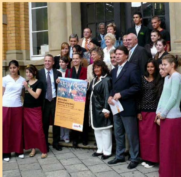
Aufstellung vor dem denkmalgeschützten Bau der Bismarckschule: Schüler, Lehrer und Stadträte